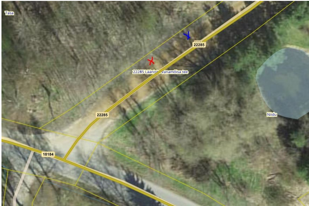
Joonis 1. Riigitee 22285 km 7,037 tähistatud bussipeatus (punane rist) ümber tõsta km 7,027 (sinine rist), väljavõte Maa- ja Ruumiameti geoportaalist

Riigitee nr 18139 km 1,331 (vasakul pool) „Vahtra“ bussipeatus tuleb ümber tõsta (Joonis 3) ja tähistada riigitee km 1,285 (vasakul pool) ning rajada ka ooteala (vt allpool p 1.1-1.3).